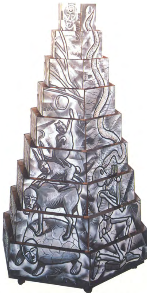
Rodrigo Cabezas, Oleo sobre madera, 1,8 x 1,2 mts. Madrid - Santiago 1993