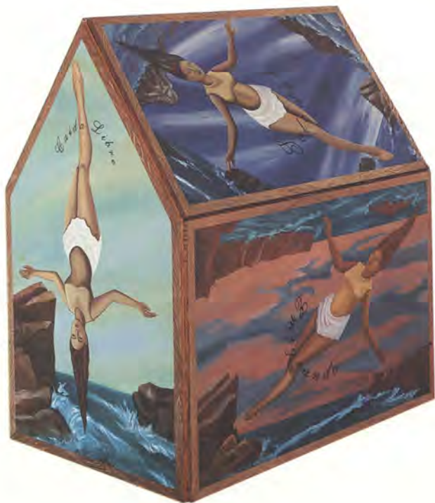
Bruna Truffa, Oleo sobre tela, 1.65 x 1.5 x 1 mts. Arica 1994