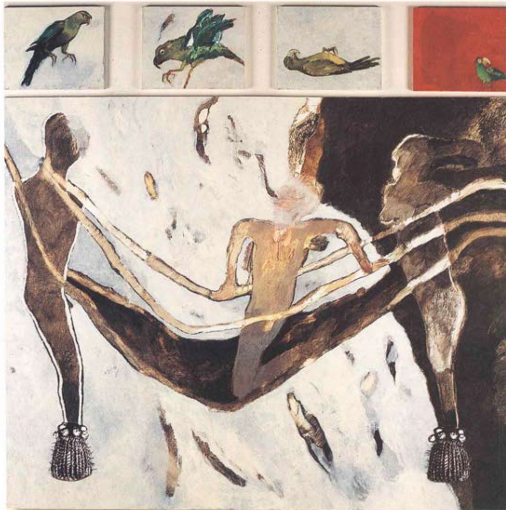
PATRICIA ISRAEL Cuando los loros no tengan donde aterrizar. 1994